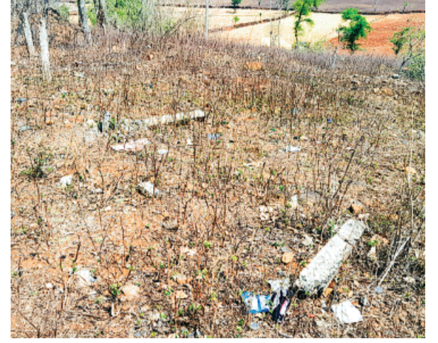
फेंसिंग को असामाजिक तत्वों द्वारा टूटा है लेकिन विभाग के अधिकारी शक्तिप्रस्त करते हुए तारों को चुराया जा रहा है लेकिन विभाग के अधिकारी इस तरह ध्यान ही नहीं दे रहे हैं।

जिले में वनों के संरक्षण और बचाव का दावा करने वाले वन विभाग के अधिकारियों की नाक के नीचे ही जंगलों की सुरक्षा को ठेगा दिखाया जा रहा है। मुख्यालय पर बाईपास स्थित नवनिर्मित रेंजर कार्यालय के सामने वन विभाग की भूमि स्थित है। इसी भूमि पर विभाग की तार फेंसिंग असे से टूटी पड़ी है पर जिम्मेदारों द्वारा तनिक भी ध्यान नहीं दिया जा रहा है।